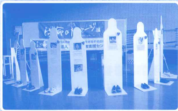
生命のメッセージ展 平成27年1月20日(火) 於 秋田県立図書館