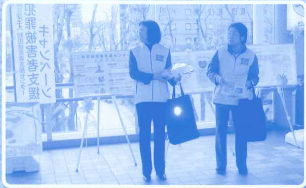
「世界道路交通犠牲者の日」キャンペーン 平成26年11月16日(日) 於 ぼぼロード