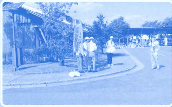
遊学舎まつりキャンペーン 平成26年9月28日(日) 於 遊学舎