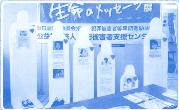
生命のメッセージ展 平成27年1月25日(日) 於 秋田県警察運転免許センター