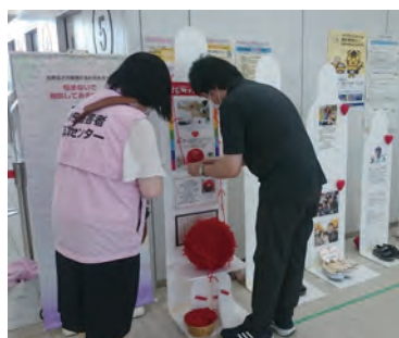
7/7～8 秋田県運転免許センター