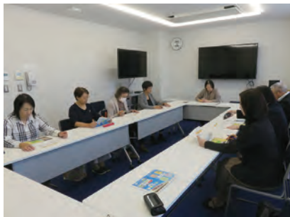
10/15 県子ども・女性・障害者相談センター 見学