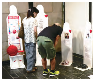
7/10～11 秋田県社会福祉会館ロビー