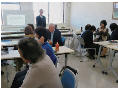
10/24 支援者のメンタルヘルス (講師 精神科専門医)