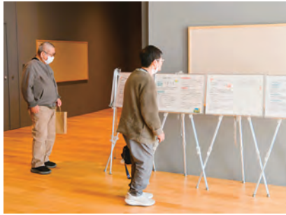
犯罪被害者支援 パネル展示