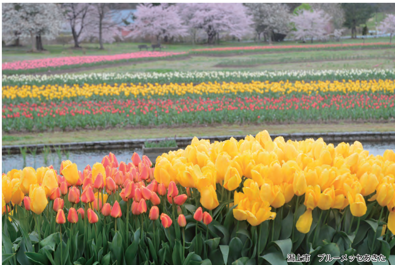
湯上市 ブルーメッセあきた