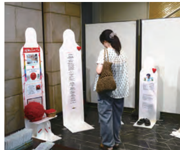
7/10～11 秋田県社会福祉会館ロビー