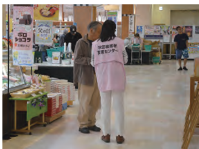
6/11 いとく鷹巣ショッピングセンター