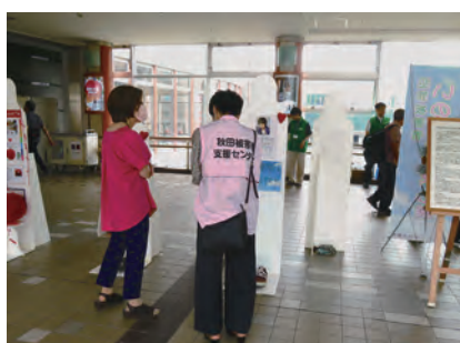
6/30 秋田駅東西連絡自由通路ぼぼろード