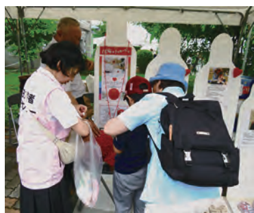
7/6 秋田刑務所矯正展