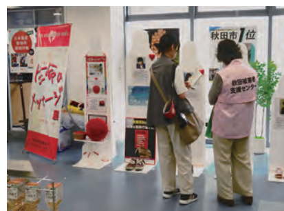
6/27 道の駅秋田港ポートタワーセリオン