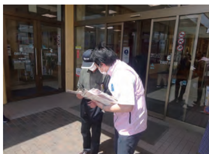
6/5 タカヤナギイーストモール大曲店