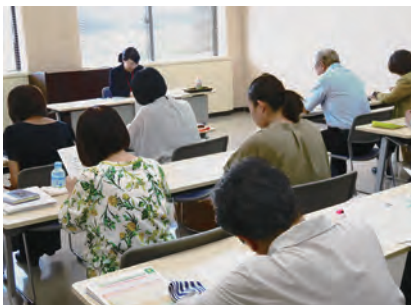
8/22 女性被害の現状 (講師 県女性相談支援課長)