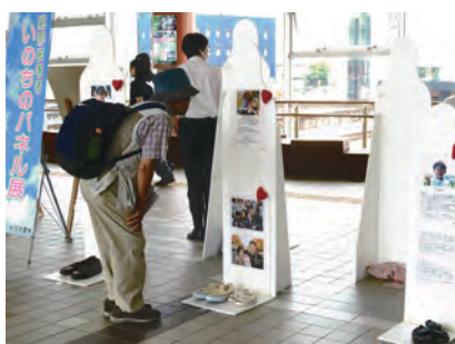
6/30 秋田駅東西連絡自由通路ぼぼろード

秋田県では毎年6月30日を「犯罪被害を考える日」と条例で定め、県や警察、被害者支援センターが連携してキャンペーン活動を行います。