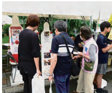
7/6 秋田刑務所矯正展