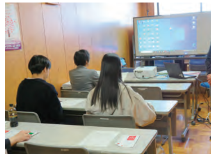
11/5 被害者支援センターの広報・啓発活動 (県警犯罪被害者支援大学生ボランティアと合同)