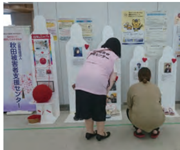
7/7～8 秋田県運転免許センター