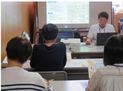
10/1 犯罪被害者に対する国や県の取り組み (講師 県民生活課)

支援活動に必要な知識や技術を取得するための講義を受けたり、関係機関を見学したり、電話相談や直接的支援の実践について学習したりしました。