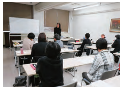
11/7 犯罪被害者のニーズに応えるための支援 (講師 NNVS 認定コーディネーター)